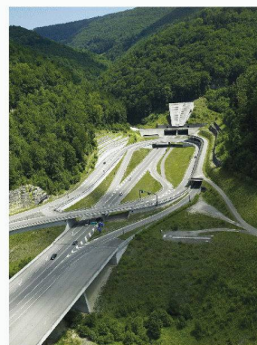
Portail-centrale Russelein nord, Tery sud

Enrobés bitumineux : deux premières pour la Transjurane Jean-Louis Cuénoud