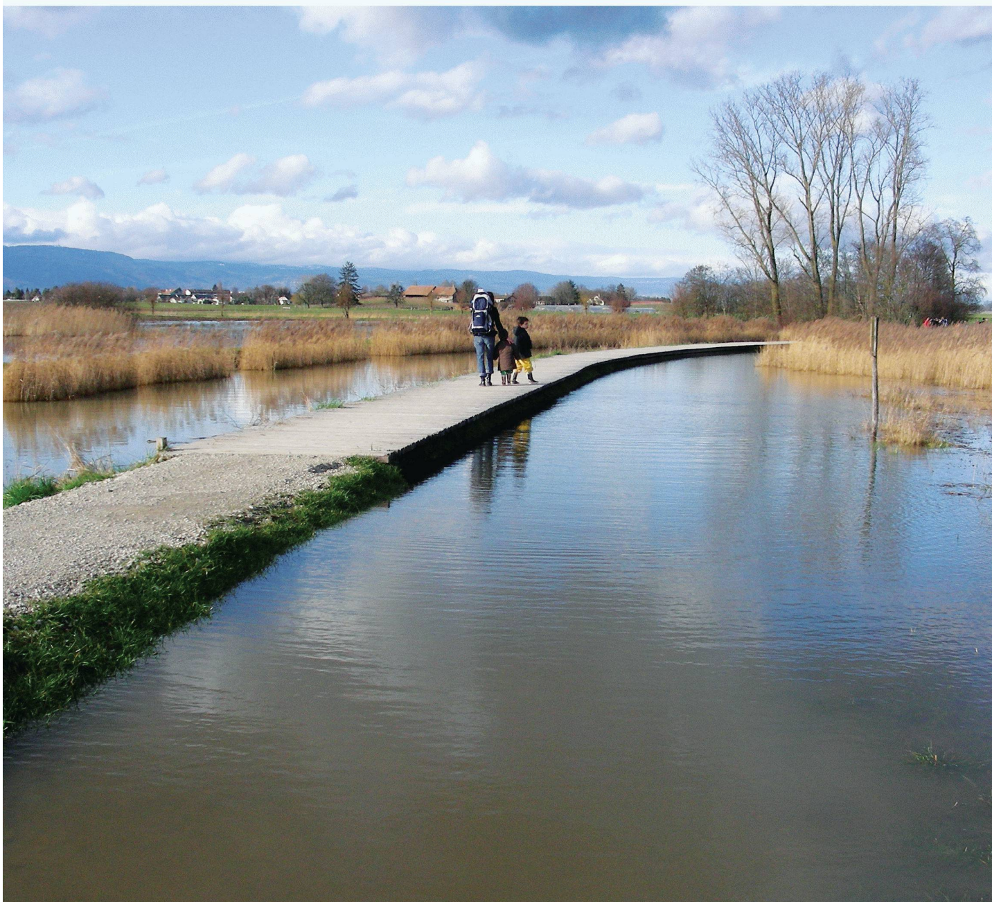
Fig. 1 : La passerelle le long de la Seymaz avec, de part et d'autre, le marais en hautes eaux (15 mars 2007)