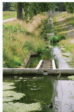
Renaturation de la Seymaz, échelle à poissons, première retenue à la jonction Seymaz / Chambetton

Construire une médiation Emmanuelle Tricoire