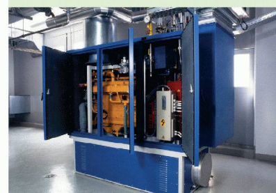
Couplage chaleur-force (CCF) équipé d'un moteur à gaz

L'électricité peut être produite à partir du gaz naturel, soit de manière centralisée par les centrales thermiques, soit par l'intermédiaire du CCF. Tandis que les installations CCF décentralisées fonctionnent depuis longtemps et en grand nombre en Suisse, les centrales thermiques centralisées ne sont qu'à l'état de projet.