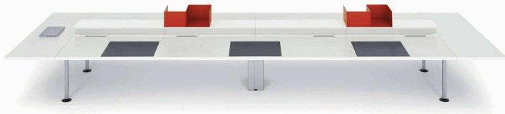
Lista Motion XXL