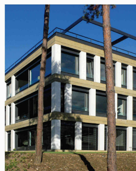
Immeuble de logements à Vésenaz, architecte Pierre Bonnet (Photo Pierre Bonnet)