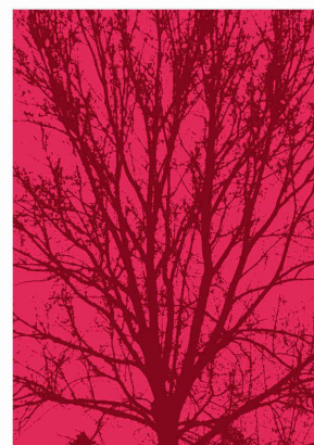
L'arbre de vie