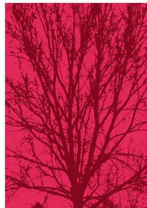
L'arbre de vie

Dans le monde des robots virtuels Auke Ijspeert et Olivier Michel