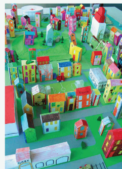
Maquette réalisée par des enfants, dans le cadre des animations de sensibilisation à l'environnement construit (Photo Tribu architecture, projet lauréat de la DKA)