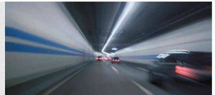
Des puits assurent l'accès aux caniveaux de câbles des tunnels

Flims et la région de Surselva sont toujours plus courus par les touristes, mais ce succès croissant pose également des problèmes: pas moins de 14 000 véhicules furent comptés pendant une durée de 14 heures, un jour de février 2002, sur la rue principale de Flims, la Via Nova. Durant les mois d'été, ce chiffre recule sensiblement, mais il dépasse toujours le cap des 8000 véhicules, dont les poids lourds constituent quelque 9%.