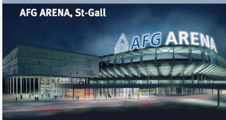
AFG ARENA, St-Gall

Vous voulez marquer des points ? HRS est votre partenaire gagnant.