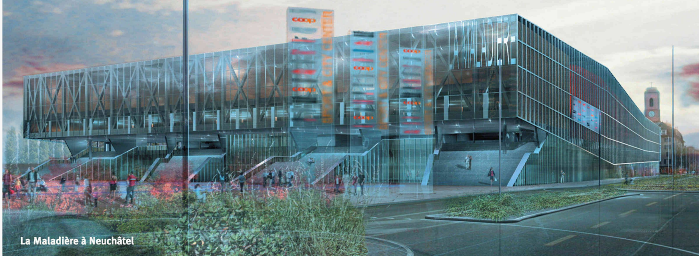
La Maladière à Neuchâtel