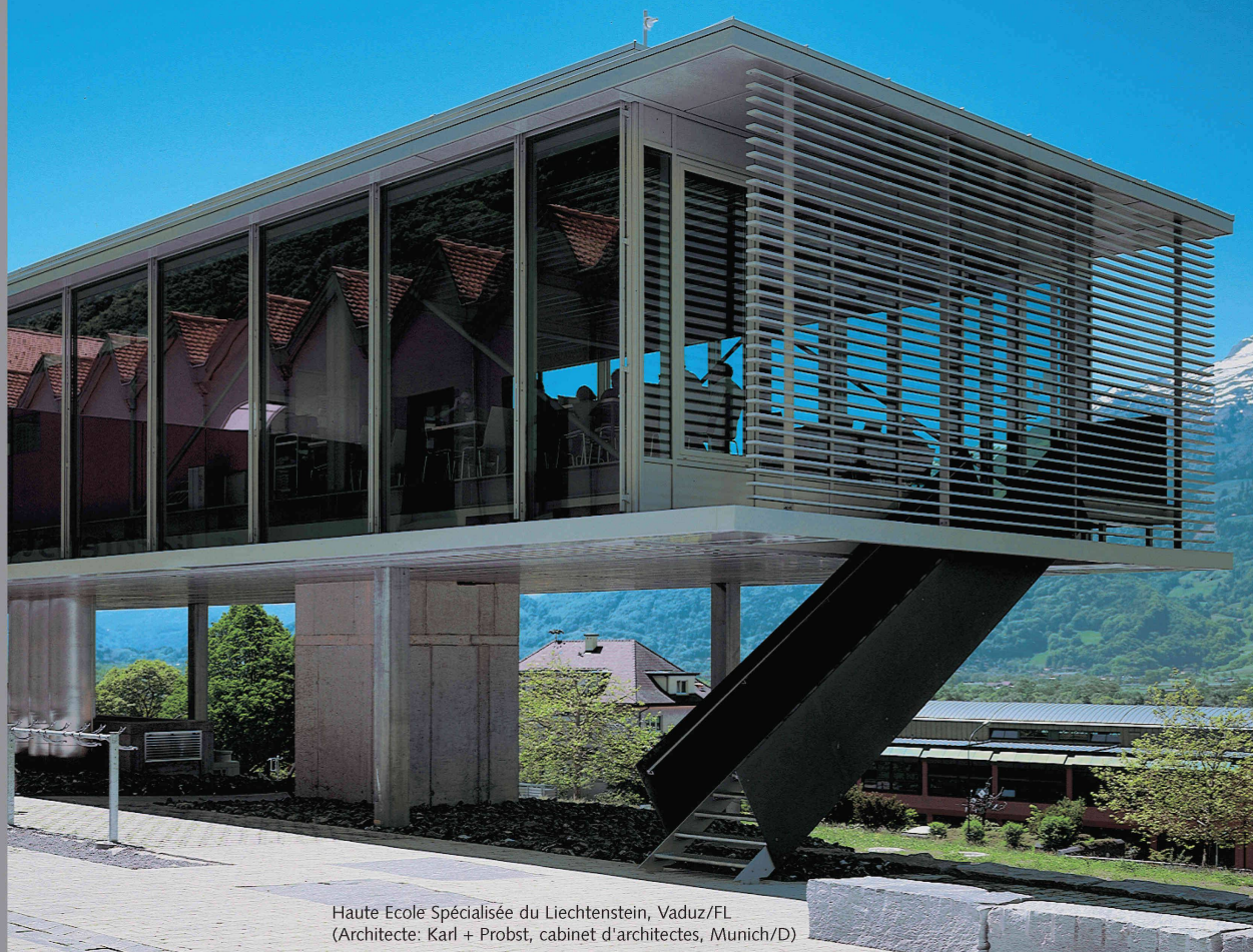
Haute Ecole Spécialisée du Liechtenstein, Vaduz/FL (Architecte: Karl + Probst, cabinet d'architectes, Munich/D)

Des solutions avec des systèmes innovants