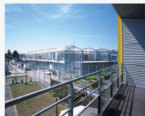
Cité Manifeste à Mulhouse, l'intervention de Lacaton/Vassal

Sécheron, une dynamique à deux vitesses Francesco Della Casa