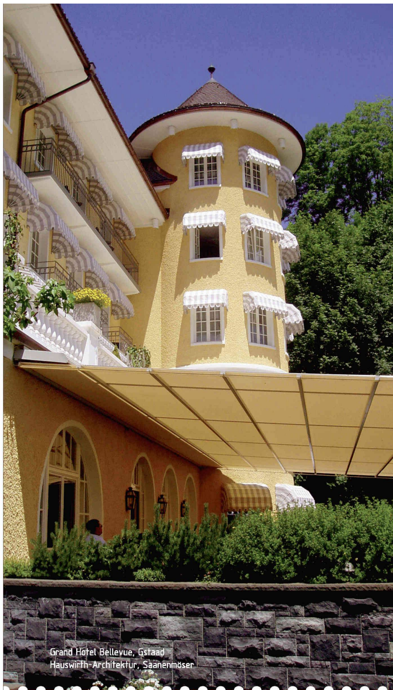
Grand Hotel Bellevue, Gstaad Hauswirth Architektur, Saanenmöser