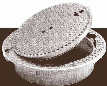
Classe D400, E600 et F900

avec ou sans verrouillage (ventilé ou non en D400 ).