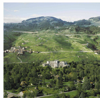
Lavaux - Evian (Photomontage Made in Genève)