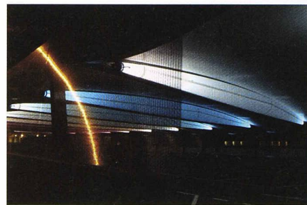
La structure Tensairity du parking de la gare de Montreux

La structure Tensairity , calculs par éléments finis Patrick Steingruber, Andrea Pedretti, Mauro Pedretti