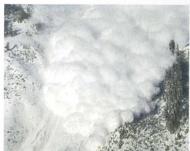
Avalanche dans la Vallée de la Sionne