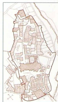
Plan du quartier de la Cité, à Lausanne, au Moyen Âge (Document tiré de l'ouvrage « Les monuments d'art et d'histoire du Canton de Vaud », tome II, Editions Birkhäuser, Bâle, 1944)

Histoire d'un projet Francesco Della Casa