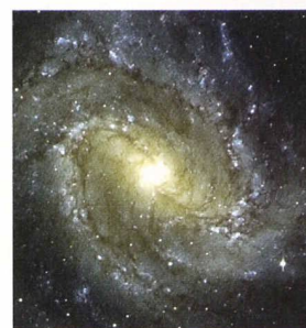
Centre de la galaxie spirale « Messier 83 », novembre 1999

Une nouvelle stratégie pour observer des trous noirs Frédéric Courbin, Pascale Jablonka et Georges Meylan