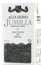
Alta Sierra Jumilla