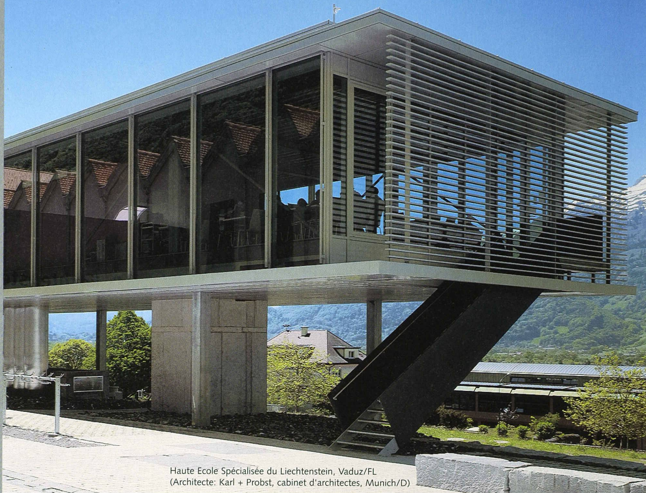
Haute Ecole Spécialisée du Liechtenstein, Vaduz/FL (Architecte: Karl + Probst, cabinet d'architectes, Munich/D)

Des solutions avec des systèmes innovants