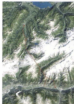
Le tracé du tunnel de base du Lötschberg (document swisstopo)

Système de guidage pour tunneliers Reinhard Deicke