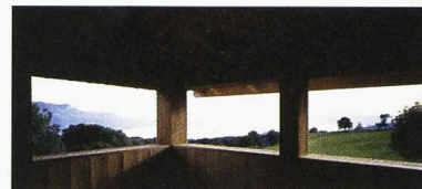
Vue depuis le pavillon de thé de la maison du Mont-Pèlerin

La chambre claire, Maison K+N à Wollerau Francesco Della Casa