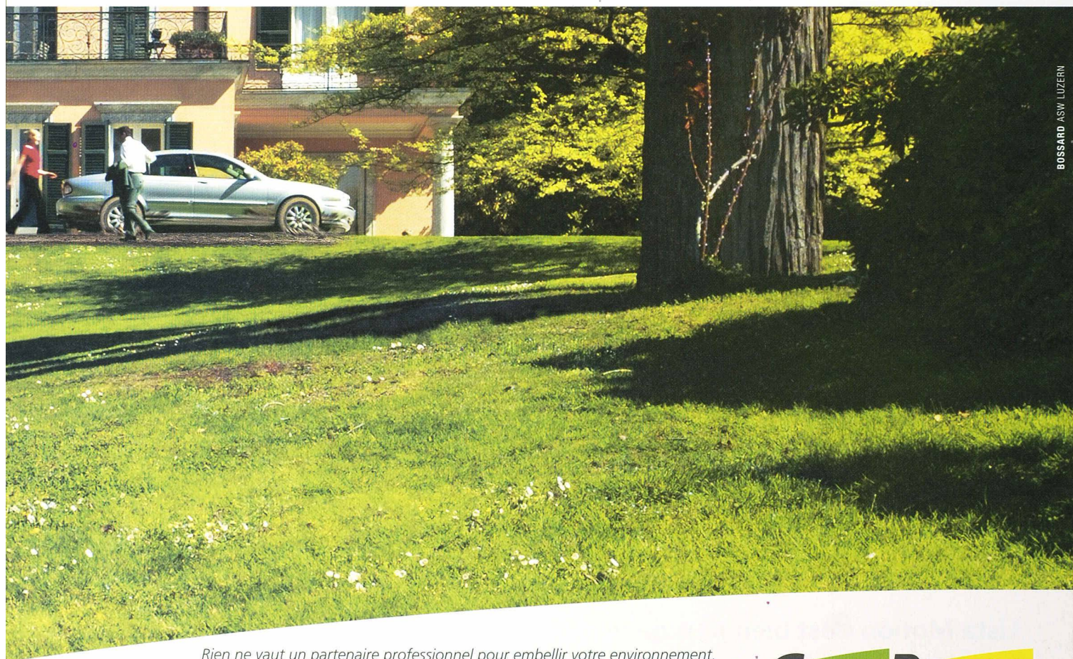
BOSSARD ASW LUZERN

Rien ne vaut un partenaire professionnel pour embellir votre environnement. Aménagements extérieurs, routes et génie civil: CREABETON vous propose des solutions toujours adaptées à vos besoins et des produits suisses de qualité supérieure. Conseil compétent et livraison rapide. Appelez-nous et nous serons très bientôt chez vous!