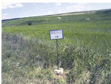
Panneau de Carrascal del Río