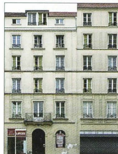
Immeuble avec laverie, rue Bichat à Paris