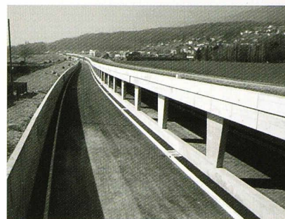
Tranchée semi-couverte de Bevaix

Tranchée d'Onnens : les nappes souterraines Chabane Larbi