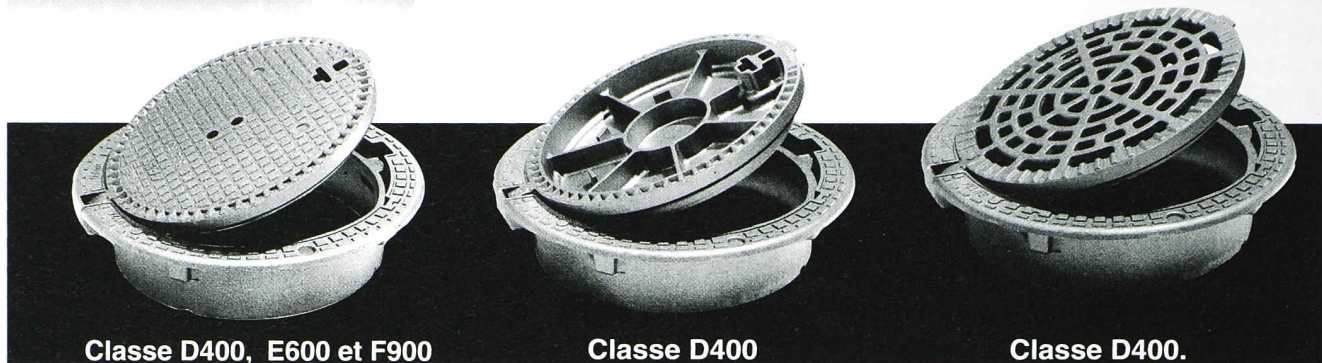
Classe D400, E600 et F900 avec ou sans verrouillage (ventilé ou non en D400).