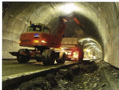
Travaux dans le tunnel de Glion

Portails Sud du tunnel de Glion - un premier pas Eric Perrette