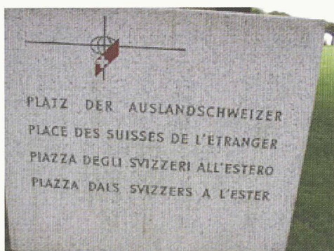
Place des Suisses de l'étranger, Brunnen

Dans cette page, nous offrons, à un ou plusieurs auteurs, le dernier mot : réaction d'humeur, arguments pour un débat, carte postale ou courrier de lecteurs. L'écrivain Eugène en est l'invité régulier.