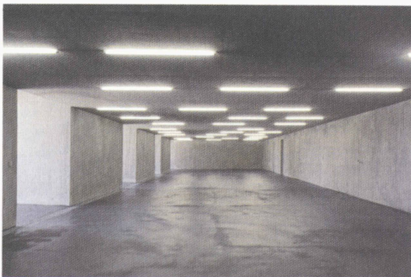
Garages souterrains à Herden - Architecte Peter Kunz