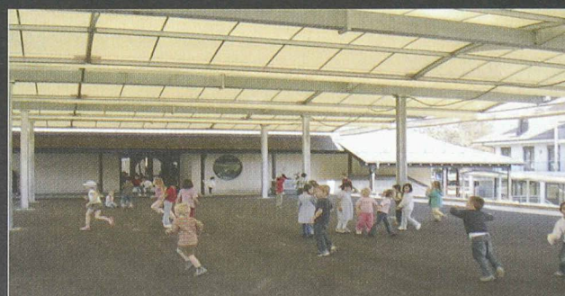
Référence (510 m 2 ) Préau du Collège de Bellevue