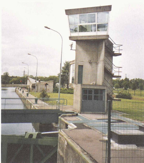
Ecluses construites par Le Corbusier à la jonction du Grand Canal du Rhin et du Canal de Huningue