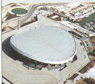
Stade Peace and Friendship

La situation du stade, directement sur le port, a représenté un défi exceptionnel pour Sarnafil. En plus des grosses chaleurs estivales et des dangers de gel en hiver, il a également fallu affronter l'air marin et les vents de différentes forces sur un bâtiment de plus de 35 mètres de hauteur.