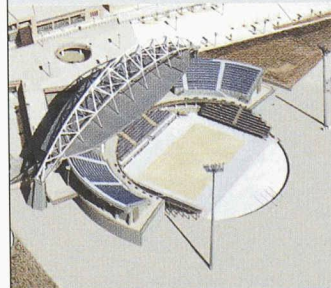
Centre olympique de beachvolley

Des membranes Sarnafil à haute résistance climatique, flexibles et durables ont également été utilisées pour différents étanchements aux infrastructures des bâtiments du Centre Olympique de beachvolley et du complexe sportif (compétitions de taekwondo).