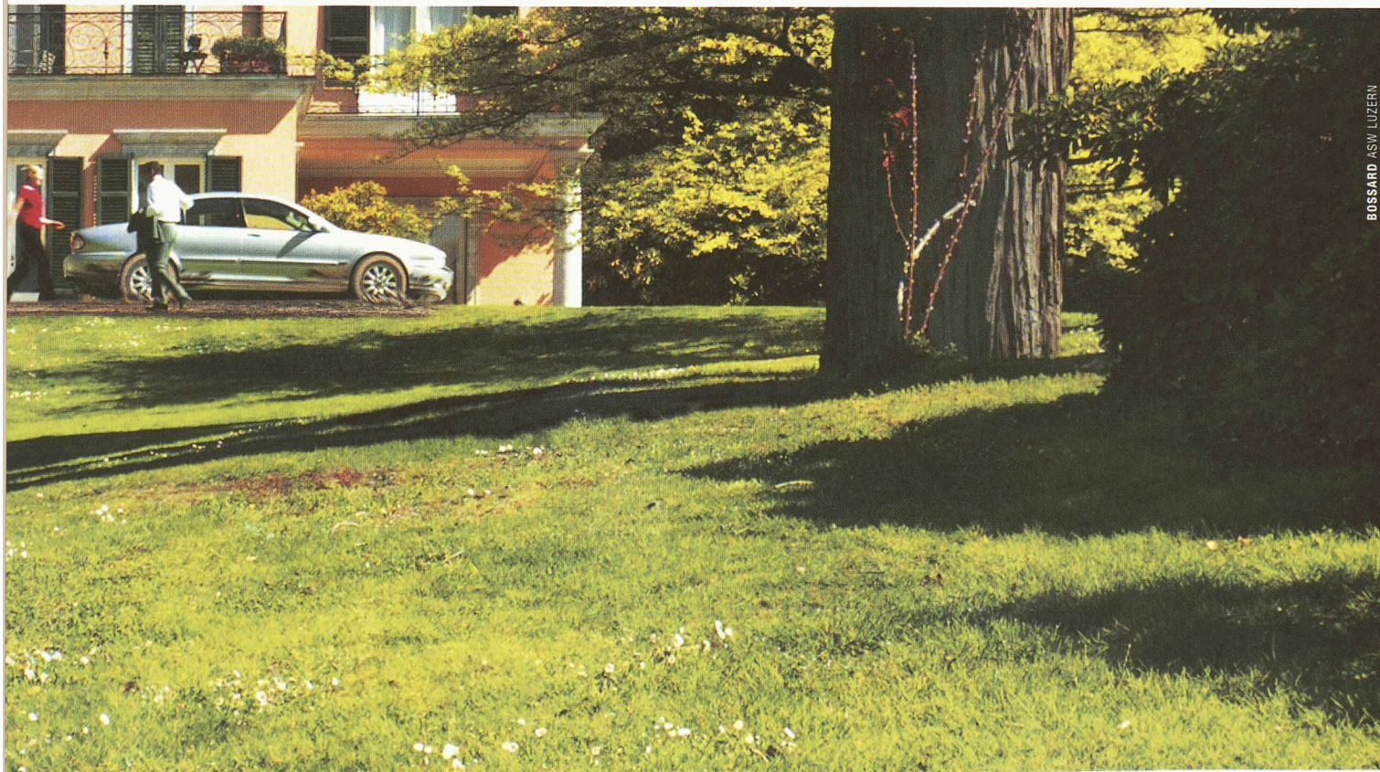
BOSSARD ASW LUZERN

creative electronic concepts Levy Fils AG, Lothringerstrasse 165 CH-4013 Basel, Telefon 061 386 11 32, Fax 061 386 11 69 www.levyfiles.ch , elektro@levyfiles.ch