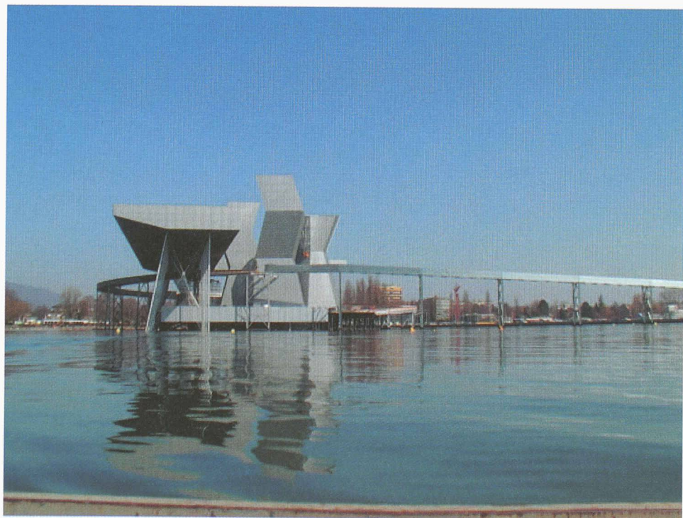
Plate-forme, passerelle et colonnes de l'arteplage de Bienne