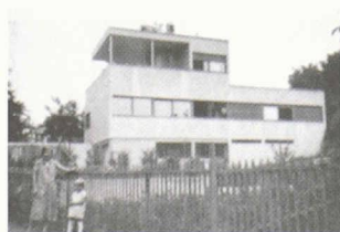
A vendre à Genève (Le Grand-Saconnex)