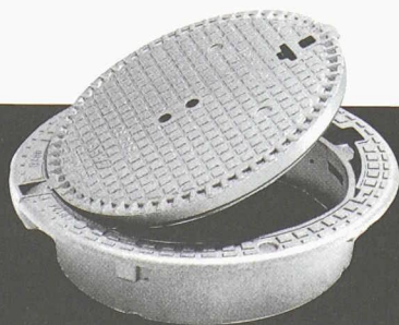
Classe D400, E600 et F900

avec ou sans verrouillage (ventilé ou non en D400 ).