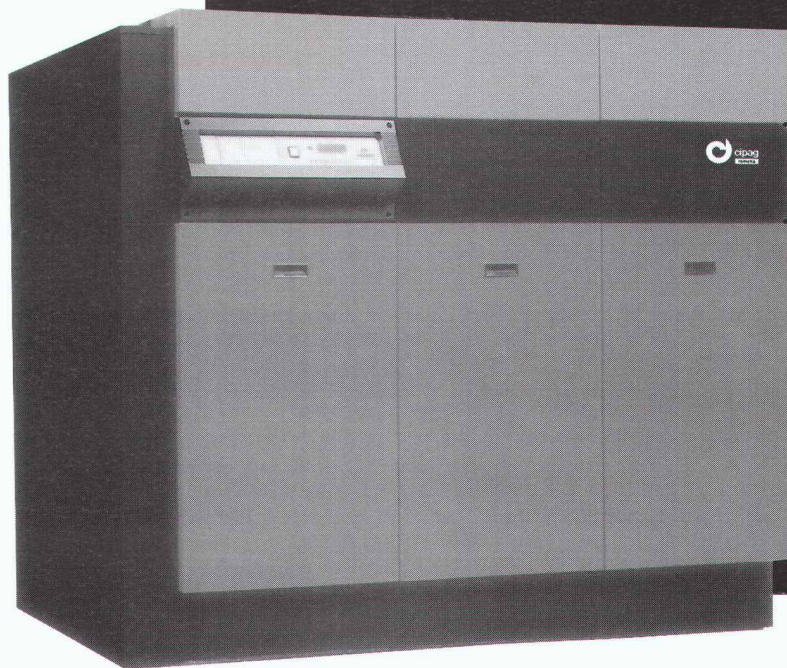
Chaudières à poser au sol, avec ou sans condensation (20 modèles de 40 à 529 kW)

SWISSBAU '99 - 26.2.99 Halle 301, Stand A 58