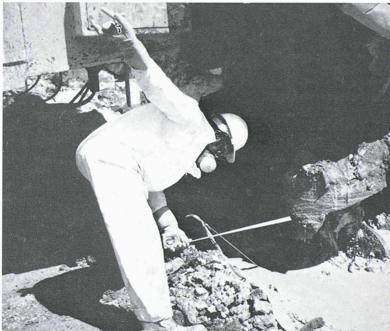
Fig. 4. – Contrôle de l'implantation d'une colonne de traitement par un technicien équipé selon le règlement de sécurité pour ce chantier

Mentionnons encore que le coût total de l'opération pour 1,5 hectare à traiter a été de l'ordre de 3,7 millions