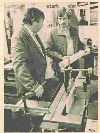
Des conseils de «pros».

Le but de l'évaluation d'un bien immobilier est d'établir une valeur de référence nécessaire pour justifier le montant de la vente, de l'achat, de l'expropriation, de la location, du prêt, de l'assurance, de l'engagement ou de la taxation d'un bien.