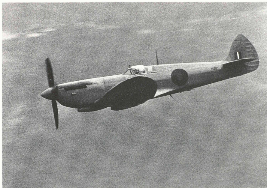
L'aviation très souvent à la pointe du progrès. Vickers-Supermarine Spitfire, type sur lequel on a pour la première fois expérimenté un composite.

Il existe de grandes banques de données, relativement générales, comme par exemple :