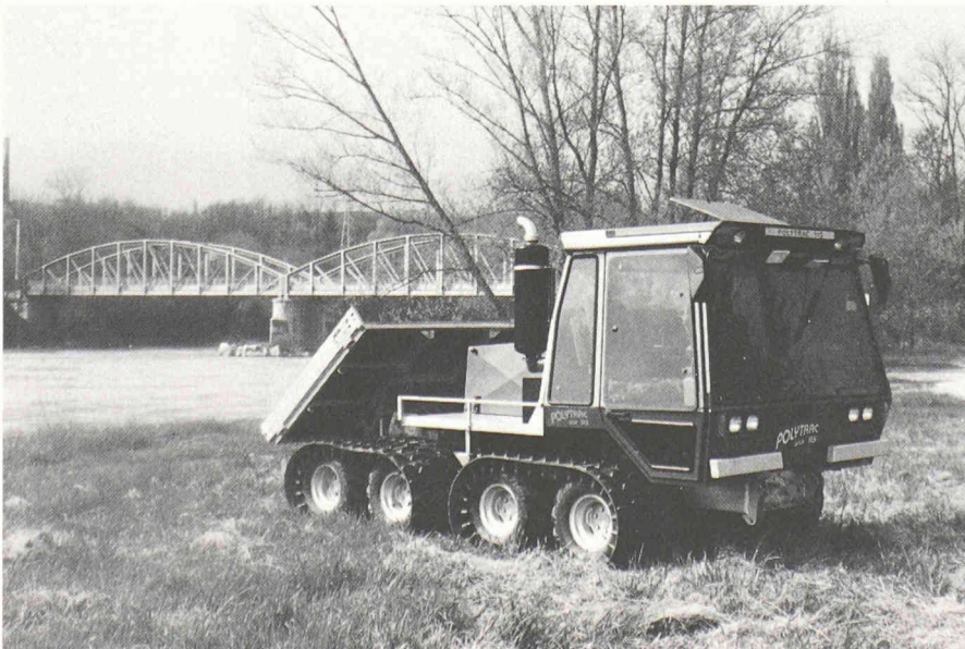
Véhicule Polytrac à entraînement entièrement hydrostatique 8 x 8.

Un défi de plus qui sera relevé comme l'ont été tous ceux qui ont conduit, depuis un siècle, nos ingénieurs et techniciens à faire du nom de Genève un «label» en matière de production industrielle.