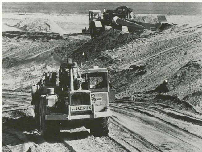
Scrapers automoteurs 631B Cat du parc de 20 machines Cat ayant participé au creusement des batardeaux pour la construction du barrage de l'Escaut oriental — un contrat qui nécessitait le déplacement de 2250 millions de m 3 de matériaux en quatorze mois.

Les effets de ce vaste système de protection des eaux sont sensibles, et notamment pour le Rhin qui, avec les flux de nappe phréatique de ses deux rives, fournit de l'eau potable à quelque 20 millions de personnes. Si, il y a quelques années encore, le Rhin était sale et son eau épouvantablement trouble, il offre de nouveau à l'heure actuelle — et malgré les accidents chimiques qui l'ont pollué récemment — un espace vital acceptable pour les espèces aquatiques animales et végétales. Sa teneur en oxygène a en effet augmenté jusqu'à son point de saturation, de 10 µg/l. Depuis 1971, la concentration en mercure et composés a chuté de 3,0 à