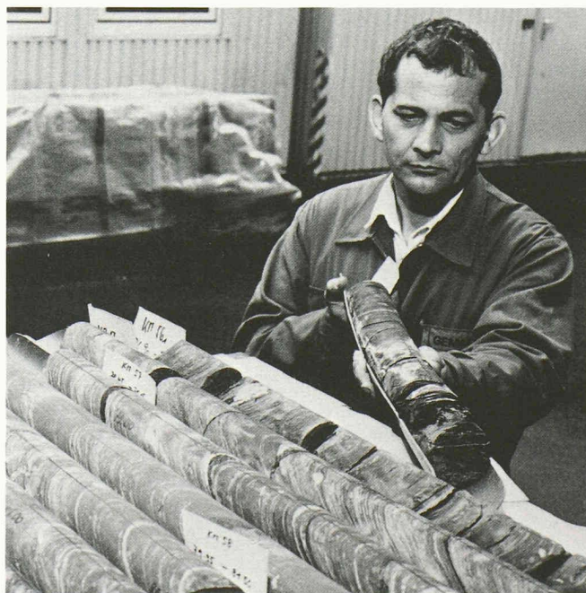
Avec quelle sécurité pourrait-on confiner dans cette roche (marne valanginienne) des déchets de faible et de moyenne radioactivité? Voilà ce que doivent préciser les forages de la Cédra actuellement en cours à l'Oberbauenstock dans le canton d'Uri. Ces forages sont entrepris à partir d'une galerie de service du tunnel du Seelisberg. Lors de la construction de ce dernier, la marne s'est révélée très imperméable.