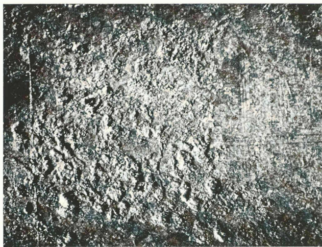
Fig. 3. — Attaques par corrosion typiques d'éléments en acier galvanisé exposés librement aux intempéries, dans la zone du trou (après enlèvement de la couche de zinc).

l'extérieur. Mais d'autre part, il se peut que cela gêne la déshumidification de l'interstice. C'est pourquoi il est avantageux, après avoir posé la cheville, de remplir complètement le trou d'une mousse à pores fermés, par exemple à base de polyuréthane ou de mastic anticorrosif à élasticité permanente, notamment à base d'huile de vaseline ou de bitume. Il faut par ailleurs vérifier l'étendue des modifications de telles mesures sur le fonctionnement des chevilles, en particulier sur leur comportement à l'auto-expansion.