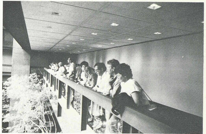
Rencontrer un conseiller d'Etat vaudois à New York!

East Harlem, les tristes quartiers périphériques de Bronx, Queens ou Brooklyn : à South Bronx, on dit qu'il y a 100000 appartements brûlés délibérément par leurs propriétaires, qui voulaient ainsi supprimer des bâtiments devenus non rentables. Et pendant ce temps, Wall Street : la danse effrénée des millions, des milliards de dollars qui changent de mains par la grâce d'un téléphone ou d'un écran d'ordinateur... I love New York? Allons-y voir! Départ pour Byzance!