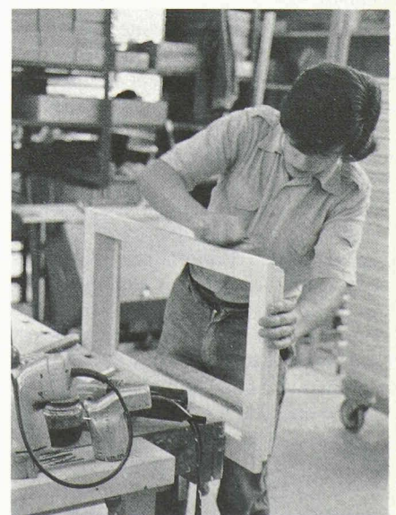
Les recherches entreprises depuis des années dans les instituts spécialisés prouvent que le bois des arbres malades est sain. Les entreprises du bois peuvent donc le travailler sans problème — pour les constructions en bois, les toitures, les fenêtres, les aménagements intérieurs, les meubles, etc.

On recense dans le monde près de 60 000 plantes qui forment du bois, dont 3000 à 6000 sont en fait utilisées. Les arbres ne sont pas seulement les organismes vivants les plus grands de la Terre, mais aussi ceux qui vivent le plus longtemps. Certains pins en Amérique peuvent atteindre jusqu'à 4000 ans et la plupart des essences européennes dépassent largement la durée de vie d'un homme. Par exemple, un arbre de nos forêts exploitées est mûr pour la récolte entre 100 et 150 ans.