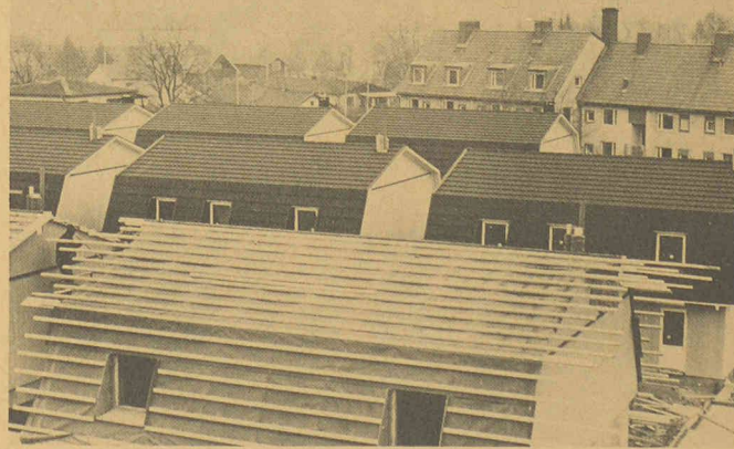
Après la pose de l'«Underlagstak», une feuille en polypropylène thermosoudé «Tymar» bitumé, les tuiles noires Decra peuvent être montées rapidement et en sécurité sur la maison du type Thermohus visible au premier plan, afin de servir comme collecteurs de chaleur solaire pendant l'hiver. Cela fait partie d'un ensemble de 62 maisons à Sala, près de Stockholm.

La SIP, Société genevoise d'instruments de physique, a reçu du géant américain Rockwell International une commande portant sur la fourniture d'une série de grandes machines à pointer et aléseuses-fraiseuses de la dernière génération, pour un montant d'environ 8 millions de francs. La livraison sera échelonnée jusqu'en mars 1985. L'entreprise genevoise a par ailleurs été chargée