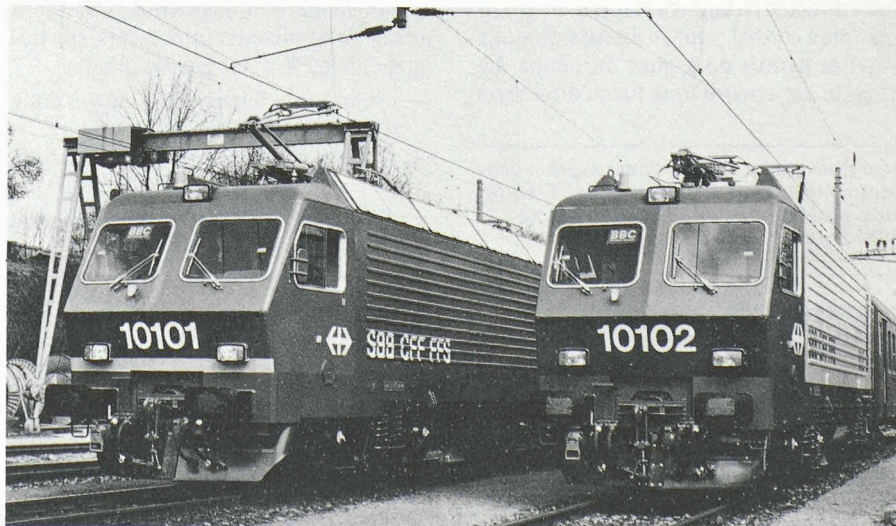
Les CFF demain : investissements concentrés sur les NTF (voir IAS n° 5/1984), innovation technique ralentie : les Re 4/4 IV resteront quatre, sans qu'une nouvelle génération soit en vue.

d'avions et de véhicules d'Altenrhein, dont il a notamment dirigé le secteur des